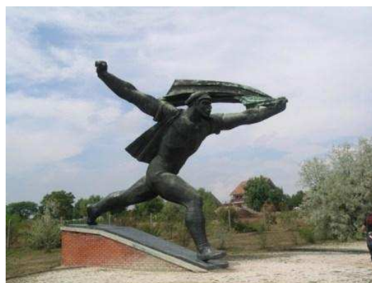
Parco delle Statue

Ultimo giro per il centro tra un ritorno al Museo di Arti Applicate per comprare altre cornici liberty in un negozietto di fronte al museo, il Mercato Centrale e Váci Ut, poi al campeggio.