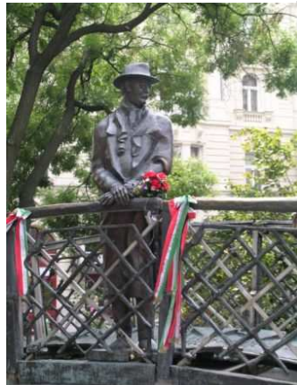
La statua di Imre Nagy di fronte al Parlamento

Ci dirigiamo verso Egerszalock, località vicina ad Eger ed a pochissimi chilometri dal campeggio, dove c'è una sorgente calda che ha formato una collina bianca di calcare. Dovrebbe sorgere qui il più grande complesso termale d'Ungheria. Per il momento è tutto un cantiere e l'unica cosa agibile sono alcune piscine di acqua termale calda sotto la collina. Ampi parcheggi. C'è un gemellaggio con Pammukale (Turchia). La sorgente attualmente non è visitabile per lavori (e dopo?). Impostiamo Hollókő sul Tom Tom e seguiamo le indicazioni. Dopo alcune strade secondarie arriviamo sulla S3, prendiamo la direzione Budapest (N.B. anche su questa grande arteria ci sono passaggi a livello incustoditi!) e arriviamo al villaggio di Hollókő. Il paesino consta fondamentalmente di due strade e conserva intatta l'architettura rurale e le usanze contadine dell'Ungheria ottocentesca e del popolo Paloc. Alcuni lo giudicano una "sceneggiata" per turisti (a noi non è sembrato così), ma l'atmosfera è piacevole come piacevole è il panorama che si ammira dal castello. Pranzo buono e abbondante con dolci e birra a 24 € equivalenti (compresa buona mancia). Torniamo indietro per la E77 arrivando a Szécsény S22 a Balassagyarmat c'è un museo all'aperto dei Paloc, ma dopo una brevissima ricerca desistiamo per non perdere tempo.