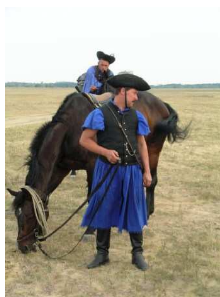
Mandriani della Puszta

Cena alla Hortobágy Csarda: locale semplice, musiche popolari ungheresi (suonate da due suonatori) non invadenti (di solito non apprezziamo i classici locali per turisti con chiassose orchestre, ma qui è molto soft); cibi: vino Merlot di Villany 2004 (Teleki), Bogracsgulyas (goulash), Magyaros bivalyokany (filetto di bue grigio con contorno: eccezionale!) pasztortarhonyaval (filetto di bufalo con contorno: altrettanto buono) e borjujava joaszony modra (grey cattle), dessert strudel e palacinta con ciliegie e cioccolato tutto per 10.000 ft con la mancia (40 euro in due!).