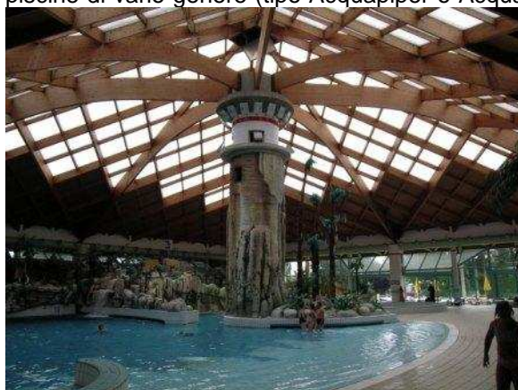
Un particolare di uno dei tre ambienti della struttura coperta delle terme di Čatež

Le Terme di Čatež sono un complesso formato da tre alberghi (tutti con SPA, usufruibili anche per i non clienti degli alberghi), bungalow e appartamenti di vario taglio e campeggio; all'interno due strutture con piscine di vario genere (tipo Acquapiper o Acquafan, con tutti i pregi e difetti di questo tipo di strutture), una scoperta e una al coperto, per cui è possibile fare bagni e passare ore di relax in qualsiasi stagione e con qualsiasi tempo. Le strutture sono forse un po' pacchiane (quella coperta abbonda di palme in plastica) ma sono perfettamente organizzate, curate, pulite e dotate di tutte le comodità (caratteristiche comuni a moltissimi complessi del genere sia in Slovenia che in Ungheria). Ma la cosa