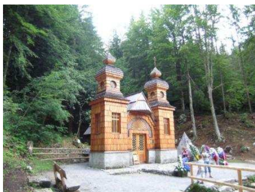
Cappella dei Russi

A Nova Gorica inizia il percorso lungo l'Isonzo, passiamo per Kanal (spiagge vicino al piccolo campeggio), Tolmin, Kobarid, Bovec, Soča, Trenta (la strada sembra chiusa dal Triglav, che si para davanti imponente), Il fiume è bellissimo; tra Soča e Trenta molte organizzazioni di rafting. A Trenta due campeggi di montagna piccoli e tranquilli.