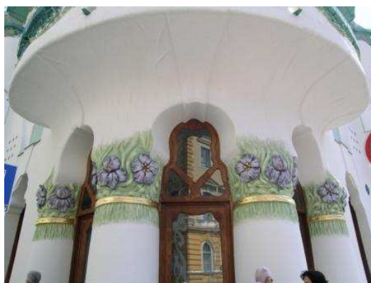
Architetture liberty sulla Tisza Lajos Körút

Ritornati al camper usciamo dalla città poco dopo le 16 direzione Gyula dove giungiamo due ore dopo. Tra il campeggio Thermal, un po' decentrato ed il campeggio Mark scegliamo questo, a due passi dalle terme, molto piccolo in verità, ma la nostra piazzola è fin troppo grande. Andiamo a vedere dove sono le terme per capire come funzionano ma tutto è in ungherese, rumeno e tedesco e non riusciamo a capire le varie scelte offerte per gli ingressi. Lo capiremo solo più tardi collegandoci al sito delle terme che è anche in inglese.