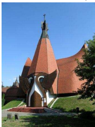
La Chiesa evangelica di Siofók

Poi ripassando per Budapest per andare in direzione opposta verso Győr. Ci fermiamo al campeggio di Tata, un complesso bellissimo con molti bungalow che è quasi deserto. Le piscine all'interno sembrano in disuso: parte vuote, una sembra uno stagno. Venendo abbiamo visto alberi che ci sono sembrati pieni di nidi di uccelli. Abbiamo letto che qui lo spettacolo del volo degli uccelli sul lago in inverno è imperdibile.