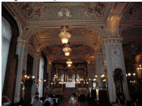
Una sala del Caffè New York

Tempo brutto. Stanotte ha piovuto e stamattina non promette nulla di buono.