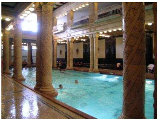
Una delle piscine del Gellert

Visita città. Prima tappa Parlamento per prenotazione (solo giorno stesso). Rinviando al giorno successivo. Visti i nostri gusti la scelta degli itinerari è in base alle architetture Liberty. Decidiamo di cominciare dal Museo Arte Applicata (bellissima la costruzione e le collezioni) e zone limitrofe. Impedibile una sosta al Caffè New York: per il locale, per il servizio, per la qualità dei dessert (Erzsébet krt. 9-11).