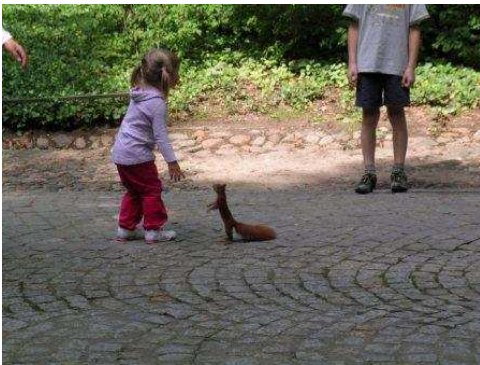
Scoiattoli al Parco Łazienki