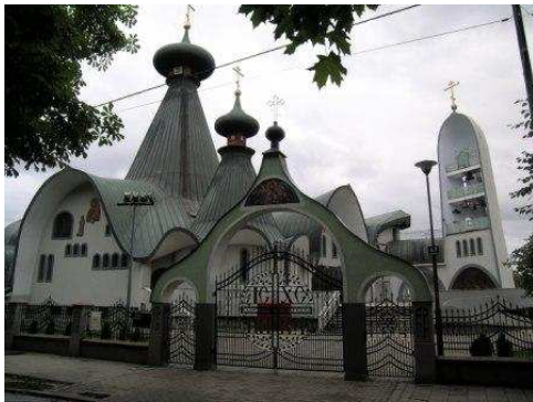
La chiesa ortodossa di Hajnowka

Alle 9 si riprende la 527 per Olsztyn (dove vediamo, passando, un albergo/campeggio all'ingresso in città sulle rive del lago che forse era meglio della deviazione per Kretowiny), poi la 16 per Augustow (strada stretta in rifacimento nel tratto iniziale e in tratti successivi). Dopo Olsztyn in zona laghi vari campeggi e hotel che segnalano possibilità di sosta camper. Si passa per Mikolajki, Orzysz, Elk, Augustow. Si passa sulla 8/E67 per Bialystok. Prendere la 19 e poi la 685. Ad Hajnowka bella chiesa ortodossa moderna (ricorda Notre-Dame Du Haut di Le Corbusier, a Ronchamp). Purtroppo piove e non è il caso di fermarsi per fare gite in battello lungo i laghi Masuri, peccato!