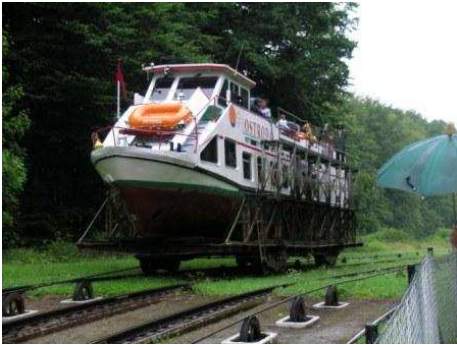
Canale di Elbląg

Verso le 9 partiamo per il canale di Elbląg. Con le indicazioni che abbiamo (imprecise, incomplete, datate e, spesso contraddittorie) ci dirigiamo verso Maldyty (dove c'è un imbarcadero) con la E77 che in uscita da