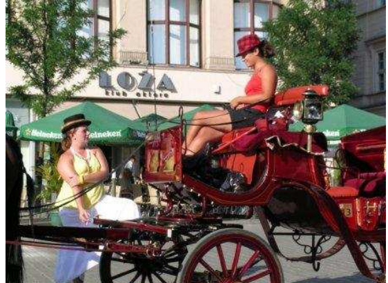
Cracovia: vetturine nella Piazza del Mercato Centrale

Visitiamo Cracovia. Per i trasporti non conviene fare biglietti giornalieri (come invece a Varsavia) perché 1 biglietto (1 unica corsa) costa 2,50 e visto che il centro è piccolo ne basta uno solo all'andata e uno al ritorno. Se si deve prendere più di un mezzo si può fare l'orario che costa 3,10. L'affascinante Piazza del mercato Centrale (Rynek Główny), nello Stare Miasto, era, purtroppo, interamente invasa dalle strutture all'aperto dei numerosi bar e ristoranti, nulla a che vedere con l'atmosfera che mi colpì durante la visita nel 1968. Per strada dei ragazzi in abiti d'epoca suonavano (molto bene) musiche medievali (acquistato loro CD – 30 zł). Imperdibile la Dama con l'ermellino, di Leonardo da Vinci, al Museo Czartoryskich (le altre tele sono tutte opere minori anche se di artisti importanti - 20 zł). Visitiamo la Kóściół Mariacka (accanto c'è un Empik che vende stampa internazionale).