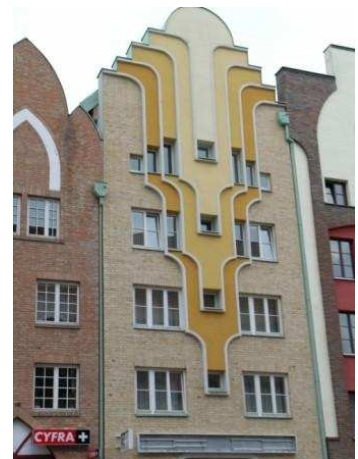
Case a Elbląg

Ripartiamo alla volta della Masuria, ma il tempo non migliora. Se avessimo