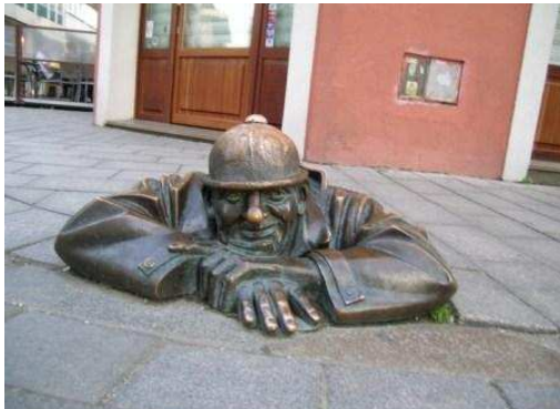
Bratislava: una delle singolari statue in bronzo del centro storico

Partiamo dal campeggio di Zakopane alle 9.30. E' domenica, quindi, tutto il traffico è concentrato intorno alle chiese. Piove e il brutto tempo ci costringe a rinunciare alla escursione al laghetto "Morskie Oko" e ai dintorni