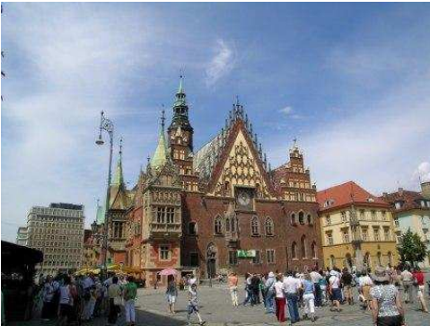
Il Municipio di Breslavia