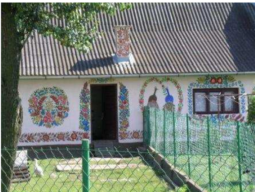
Una casa di Zalipie

Alle 9.30 partiamo direzione Zalipie. Lungo la strada appena usciti dal campeggio, che è su un lago, un volo di cormorani si alza e qualcuno sembra venire a scontrarsi con il camper.