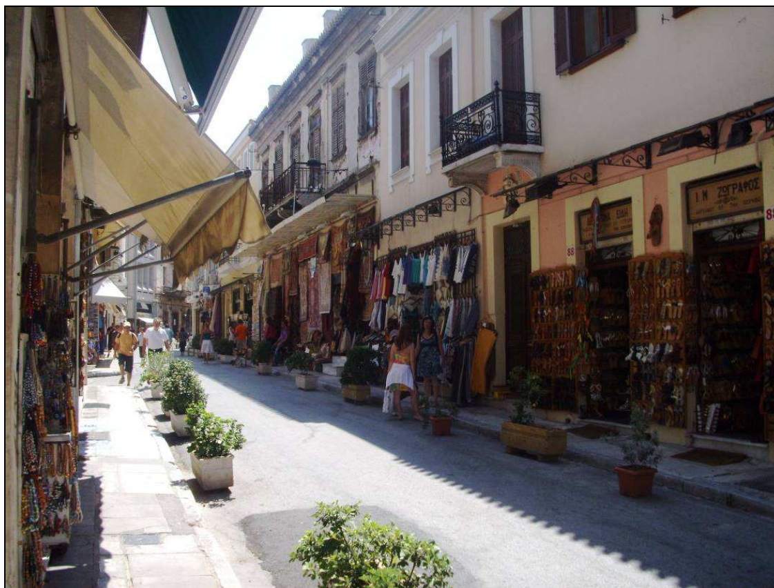
La Plaka (Atene)