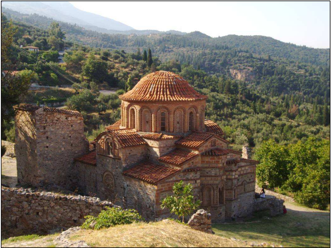
Monastero a Mystras