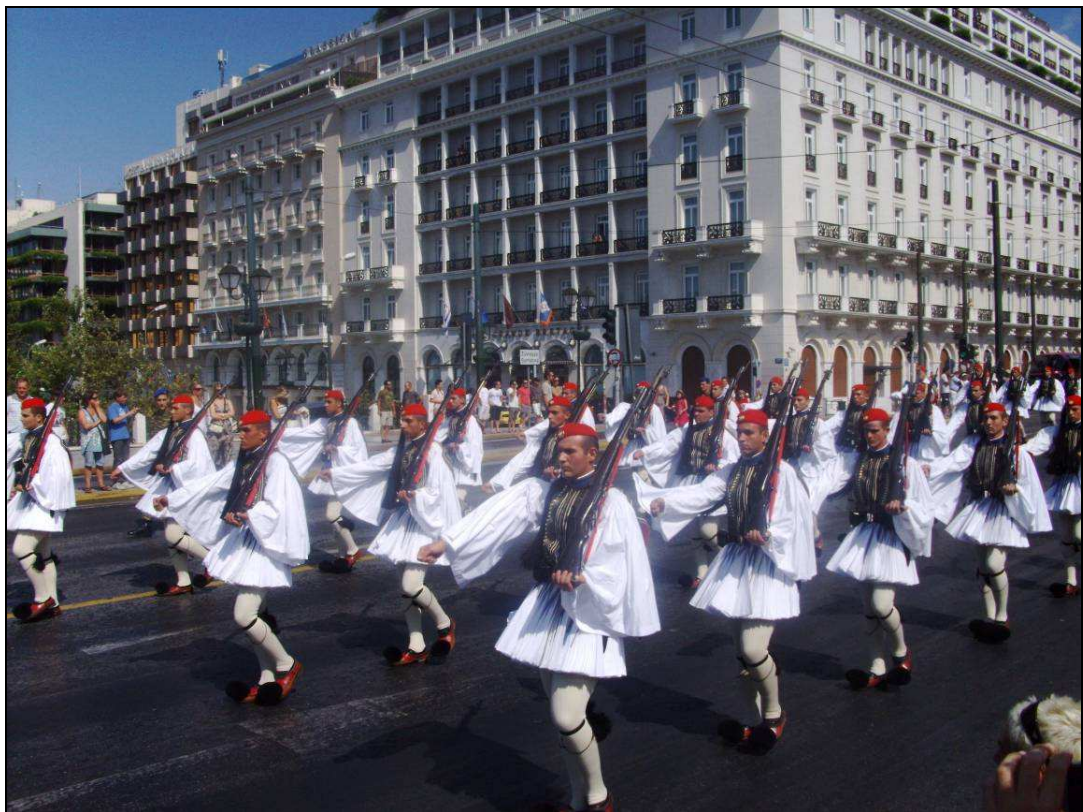
Cambio della guardia