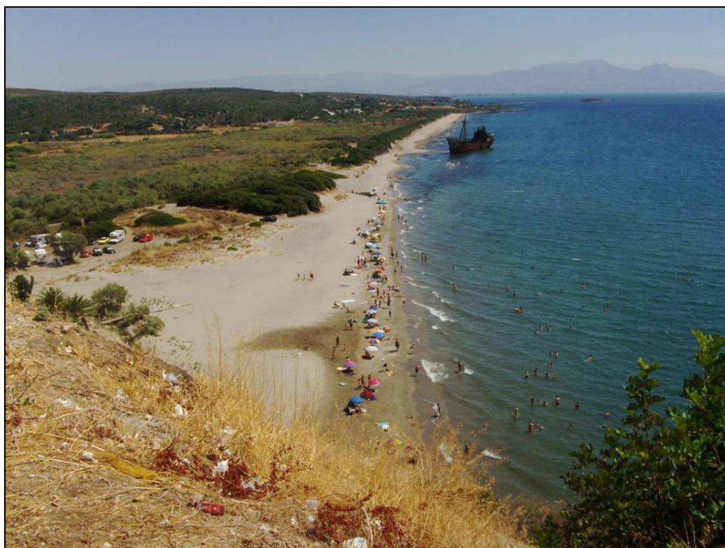
Spiaggia di Gythio

Parcheggiamo praticamente sulla spiaggia (bel posto, bel mare basso e pulito ma parcheggio assolato..ci sono solo pochi alberi).