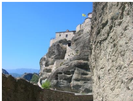
Grecia le Meteore