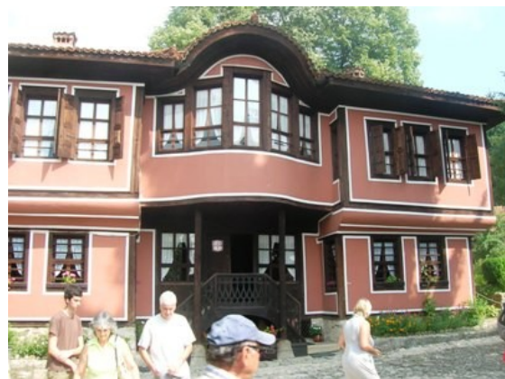
Dimore storiche a Koprivshitsa