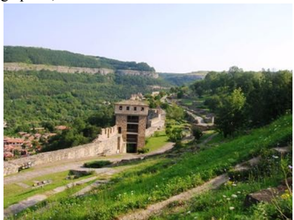
Veliko Tarnovo: la fortezza di Tsarevets

quasi esclusivamente ruderi degli antichi edifici. Bella la chiesa, ricostruita nella parte più alta della collina, con affreschi moderni di grande stile. Da questa altura si osserva il panorama della città vecchia di Veliko e di tutta la valle occupata ormai dalla sua periferia urbana. Torniamo ai camper per il pranzo e alle 14 si riparte per visitare il Monastero di Ivanovo (N43°41'41,05" E25°59'11,90") con la sua chiesa rupestre scavata nella roccia. Si raggiunge con una discreta camminata per un sentiero nel bosco che porta ad un pertugio nella roccia