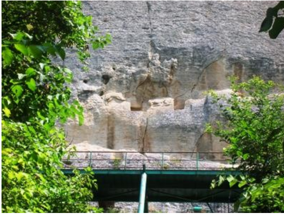
Cavaliere di Madara