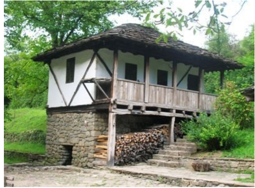
Etara: edifici del Museo Etnografico