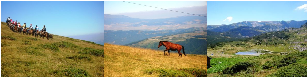
Monti Pirin e laghi di Rila

Lun 23 – Alle 9,30 il bus dell'Agenzia ci accompagna alla base della seggiovia che porta al sito dei sette laghi di Rila in alta montagna(2925 metri). Ci vestiamo bene perché la temperatura