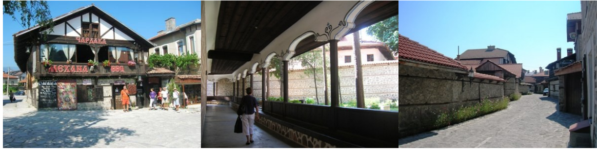
Città di Bansko

molti metri più in alto. È molto bella e suggestiva perché all'interno scorre un corso d'acqua molto rumoroso che saltella da una cascata all'altra con notevoli salti di quota. Rientro ai camper, pranzo e dopo partenza per la strada panoramica sui Monti Pirin verso ovest. Arriviamo a Bansko e sistemiamo i camper nella piazzetta dell'hotel che ci ospita. I gestori chiudono prontamente la piazza pubblica riservandola esclusivamente a noi e quindi portano le prese per la corrente elettrica e i tubi dell'acqua per il carico e infine mettono a disposizione alcune camere con servizi e docce. Per ultimo viene offerto un omaggio, al Centro Benessere dell'hotel, comprendente sauna e massaggi rilassanti. Cena in piazza tutti insieme a base di pizze e con lo slogan collaudato "io porto il mio e tu porti il tuo".