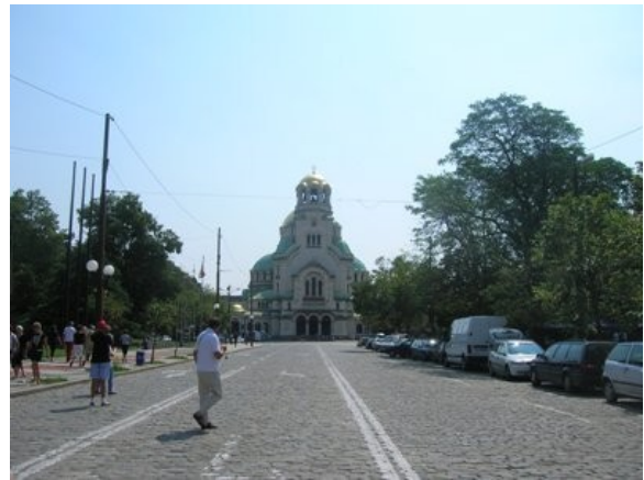
Cattedrale Hagia Sofia