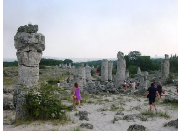
foresta pietrificata di Pobiti Kamani

Attraversiamo la grande città e dirigiamo verso nord sulla strada costiera per un'altra cinquantina di km. Nei pressi di Balcik prendiamo una deviazione per "Laguna" dove si trova il nostro campeggio. Siamo sulla collinetta che sovrasta il mare e le piazzole sono a terrazzamento degradante verso l'arenile. Spira una leggera brezza che rinfresca l'aria. Dopo