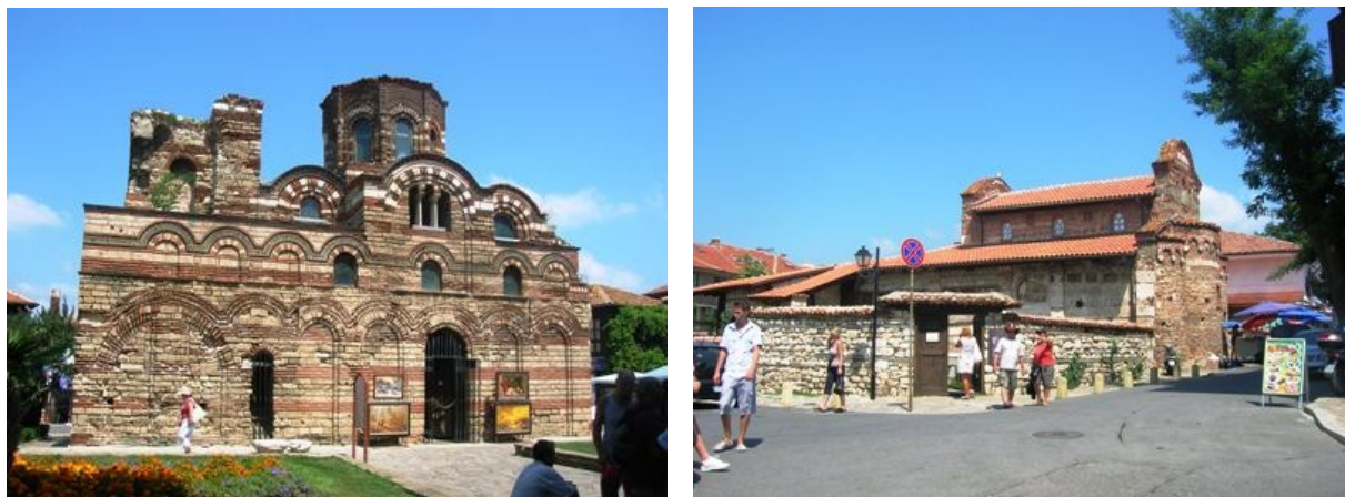
Chiese bizantine a Nessebar

piccole e grandi, circondate da una miriade di case e casette dall'architettura tipica, in bell'ordine, e tanti negozietti di artigiani locali. Il