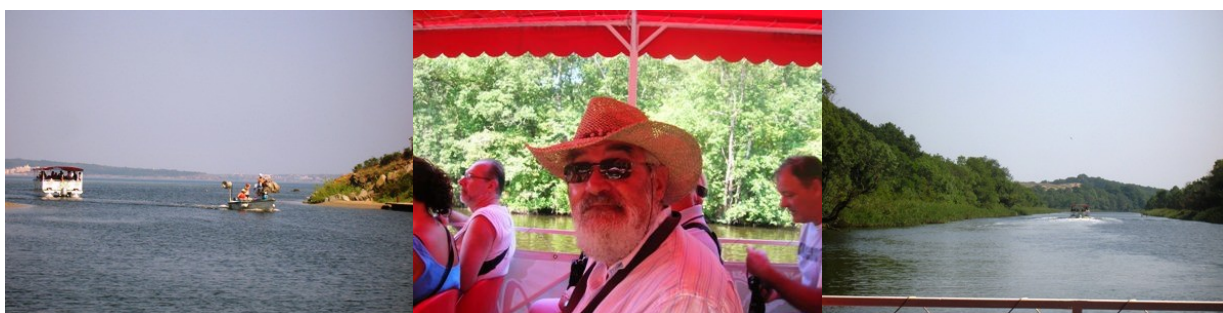
Sul fiume Ropotamo

Dom 15 – Giornata calda già di mattina. Alle 8,30 il bus dell'agenzia ci carica tutti per andare nel Parco Naturale di Ropotamo. Con alcune barche percorriamo il fiume Ropotamo che dà il