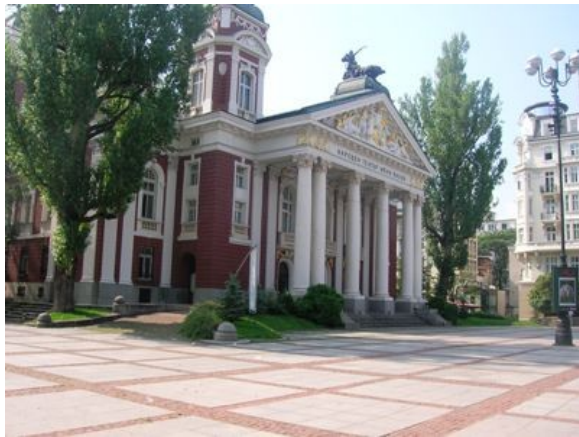
Teatro "Ivan Vazov"

Sab 7 – Partiamo, con il bus dell'Agenzia, dal campeggio per visitare la città. Il centro storico è molto bello. Il primo impatto è con l'alta colonna alla sommità della quale si staglia la figura