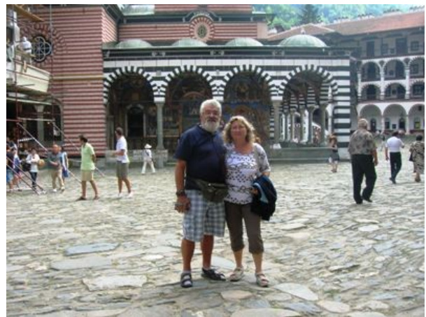
Monastero di Rila

domenica, ma soprattutto perché è davvero eccezionale. Data l'ora invece di entrare nel sacro recinto andiamo prima al ristorante prenotato adiacente al monastero (offerto dall'Agenzia: zuppa di legumi ottima, trota alla griglia con patate all'aneto ottima, gelato e birra). Poi visita al monastero. La guida bulgara illustra ampiamente la sua storia e la nostra traduce tutto in italiano. La chiesa è unica nella sua architettura tipica, così come gli edifici a suo corredo, le celle dei monaci e la sala capitolare, infine il torrione di difesa centrale in pietra che alloggia attualmente le campane. Ripartiamo alle 17 per il campeggio di Sapareva Banja. Sistemazione sul prato e cena comune all'esterno, poi tutti a letto.