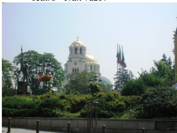
Chiesa Hagia Nedelija