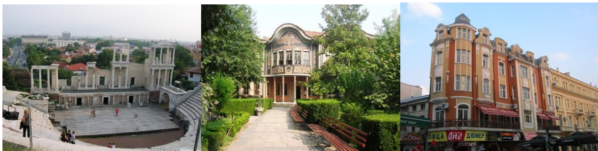
Plovdiv: Teatro Romano

Mar 17 – Partenza alle 7,30 per Plovdiv. Alle 13 siamo sistemati al campeggio appena fuori