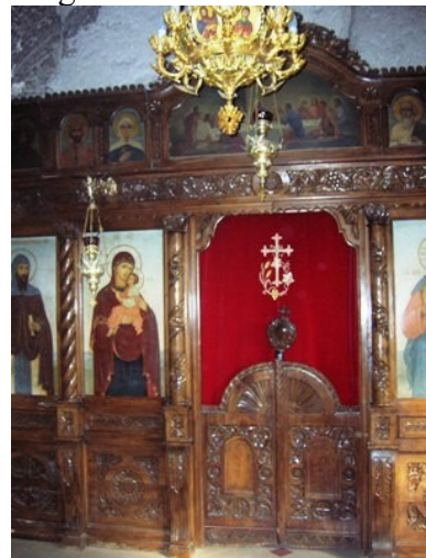
Monastero rupestre di Basarbovo

attraverso il quale si entra nell'unico vano che fungeva da luogo di culto ortodosso e che presenta ricchi affreschi sulle pareti e sul basso soffitto intonacato. In fondo alla stanza si apre una porta che immette su un ballatoio sospeso paurosamente nel vuoto a 100 metri da terra.