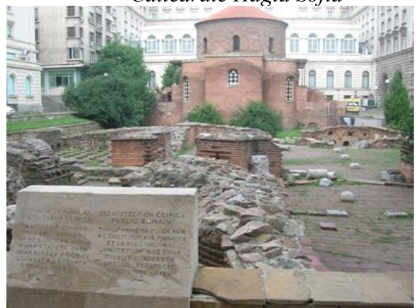
chiesa bizantina di St George

femminile di Santa Sofia, in parte dorata, incoronata con l'aquila sul braccio, patrona della città, lì vicino il Palazzo del Parlamento nell'ex sede del Partito Comunista di vecchia data. Poi a continuare, il Teatro Ivan Vazov, nelle forme classiche con timpano e colonne, davanti c'è una bella fontana zampillante con figura femminile in bronzo e il parco verde cittadino dove si incontrano