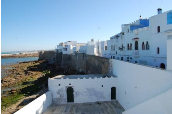
La Medina di Asilah

arriviamo al nuovo porto di Tangeri (Tangeri Med) alle 18 (cioè alle 19 ora italiana). Lunga attesa alla dogana per far timbrare i permessi di importazione temporanea dei camper. Usciamo dalla dogana alle 21 e, effettuato il cambio di valuta a un box immediatamente dopo la dogana ed il pieno di gasolio poco oltre, arriviamo, con