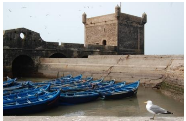
I bastioni portoghesi di Essaouira