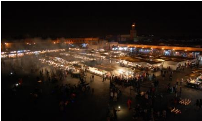
Place Jemaa el-Fna a Marrakesh

Si vede che siamo scesi a sud, alle 7 c'erano 13°C. Verso Marrakesh attraverso lo spettacolare Passo Tizi-n-Tichka (2260m s.l.m.), ma la giornata non è delle migliori: tira un forte vento, piove, fa freddo (8°C), la visibilità è ridotta. A Marrakesh incontriamo il primo supermercato di tipo europeo (Marjane). Fatta la spesa ed entrati in campeggio, usciamo (in maxi-taxi perchè il campeggio è molto lontano dal centro città) per vedere, di sera, la celeberrima Place Jemaa el-Fna. Superata la moschea della Koutoubia con il suo bellissimo minareto, si accede all'immensa piazza. Place Jemaa el-Fna non è semplicemente una piazza, è "la piazza", il cuore e il ventre di Marrakesh, un grandissimo microcosmo, un caleidoscopio di colori, odori, sapori e varia umanità. Incantatori di serpenti, giocolieri, venditori di ogni cosa, donne che tatuano con l'henné, gazebo dove si mangia di tutto a prezzi irrisori, negozi di artigianato, vestiti, e altro, bancarelle di frutta fresca e secca, spezie, olive e altro, tutto allestito in maniera molto scenografica. Vista la folla e, in alcuni punti la calca, tenere ben strette borsette e macchina fotografica. Dalla terrazza del bar/ristorante sito in un lato della piazza si gode una spettacolare visione notturna della stessa. Pernottamento al Camping Ferdaous, sulla strada per Casablanca ±buoni e completi i servizi. km 226