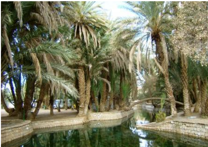
L'Oasi della Sorgente Blu a Meski.