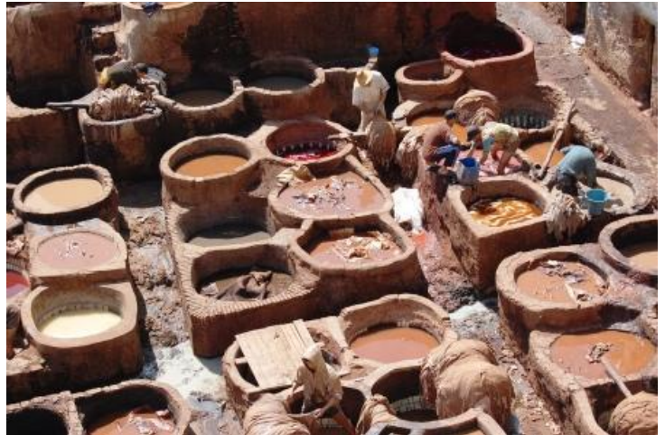
Le conerie di Fes (particolare)

16 marzo Fes ±Ifrane - Meski Partenza per il Grande Sud Marocchino, verso Ifrane e Meski. Sarà una tappa lunga, ben 420 km su strade non sempre confortevoli e con un passo montano: pertanto sveglia e partenza presto. Alle 6 del mattino ci sono 4,5°C che già alle 8.30 sono diventati 13,5°C. Una strada abbastanza bella sale fino ad un altipiano ricoperto di macchia mediterranea e conduce a Ifrane. Anche questo è un Marocco che non ti aspetti: chalet in legno, strade molto curate e pulite, arredo urbano impeccabile. Poco oltre l'abitato si capisce il perché, vedendo l'immenso parco con la residenza "di montagna" del Re del Marocco. Ifrane è, infatti, una