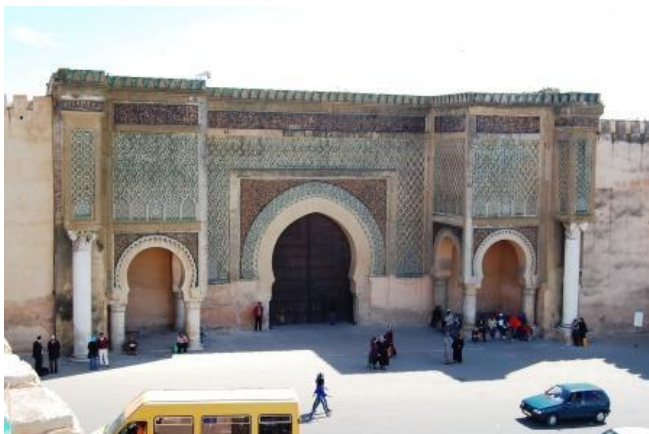
La Porta di Bab Mansour a Meknes

dove decine e decine di botteghe (in realtà tendoni lungo la stradina già di per se stretta) dove un gran numero di sarti, sia giovani che anziani, cuciono su macchine di 30-40 anni fa i variopinti vestiti delle donne marocchine. Autostrada da Meknes est a Fes ¼e poi, seguiamo le indicazioni per il campeggio "Diamant Vert" (all'interno di un parco acquatico). i servizi sono molto scadenti (c'è però il pozzetto per wc nautico) . km 91