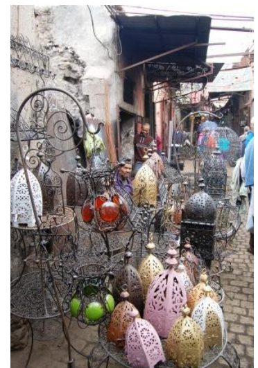
Il suq del ferro battuto a Marrakesh

Si visita il territorio con dei fuoristrada. Visitiamo la Valle dell'Almen, le sue rocce di granito rosa, i piccoli villaggi berberi a ridosso di palmeraie. Tutto è affascinante: i luoghi, la gente, i bambini sempre gentili e sorridenti. Fa molto