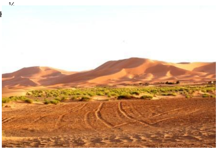
Le dune dell'Erg Chebbi

dopo lunga trattativa vari fossili per 550 DH FLR q (avevano chiesto ¼ / D VWUDGD Y f presenta ampie aree di sosta con tende di venditori di artigianato e pozzi per estrarre acqua (grandi cumuli di sabbia con in cima un verricello). All'ora di pranzo fa caldo (25°C, la mattina alle 7 erano 9,5°C). A Thineir ci accoglie il campeggio "Le Soleil de Thinerir" (buoni servizi, anche scarico per wc nautico). Constatiamo di non ricevere più il segnale TV e sarà così fino a Casablanca. In pratica al di sotto della catena del Medio Atlante la parabola non riceve. Al ritorno a Roma abbiamo saputo che occorreva modificare l'angolo di skew, ossia ruotare l'illuminatore della parabola (v.note) Veramente, in seguito, a Essaouira, ci hanno proposto di fare quella operazione, ma abbiamo preferito soprsedere. km 216