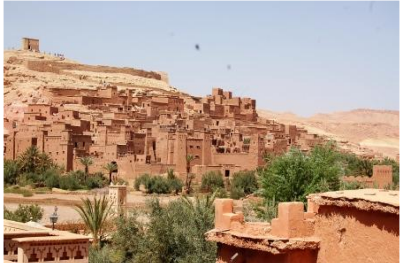
La Ksar di Ait Benhaddou

Dopo giorni abbastanza impegnativi, oggi, relax! Bighelloniamo con tranquillità per Ouarzazate: la kasba, la Medina, il Museo del Cinema (molte scene di celebri film sono state girate qui). Per entrare nella suggestiva Ksar di Ait Benhaddou occorre guardare (passando su un percorso di pietre) un torrentello. Fantastica è la vista della ksar (patrimonio dell'umanità ± UNESCO) e altrettanto il panorama che si gode dalle sue torrette. Pernottamento al "Camping de Ouarzazate". km 78