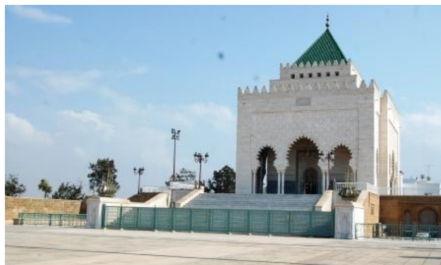
Mausoleo di Mohammed V° a Rabat