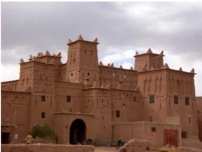
La Kasba di Ameghidil