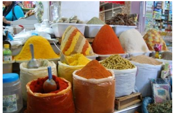
Banchetto di spezie nel suq di Meknes

L'andamento climatico è sempre lo stesso: alle 7 ci sono 10.5°C, alle 9 sono diventati 12°C, all'ora di pranzo farà decisamente caldo. Uscendo dal campeggio ammiriamo il bel panorama sulla vallata verdissima e sulle colline fitte di uliveti. A Meknes visitiamo (con la guida) la città berbera, la città araba con la scuola coranica, i granai, la Medersa Bou Inania e il Mausoleo di Moulay Ismail. Pranziamo (300 DH) sulla grande terrazza di un ristorante di fronte alla imponente Porta di Bab Mansour. La mia Pastilla è favolosa, ma anche le altre portate soddisfano i commensali. Al mercato delle spezie e dei dolci grande varietà di frutta sempre, come vedremo in tutti i mercati marocchini, disposta in maniera molto scenografica. Ma tutto il suqè da vedere ed esplorare; singolare è il tratto