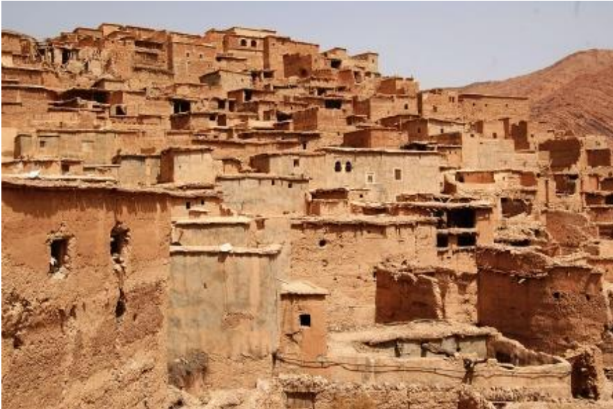
Villaggio berbero nella Valle dell'Almen con le case di paglia e fango impastati

caldo e, all'inizio della giornata, il panorama era offuscato da sabbia in sospensione prodotta da una tempesta nel deserto e arrivata fin qui. Pranziamo in una piccola, minimalista e rustica trattoria, all'aperto, sotto le palme; menù: tajine di pollo, acqua minerale, frutta e caffè (180 DH Y D O H D G L U H testa). Al ritorno ci facciamo lasciare a Tafraoute (a 5' a piedi dal campeggio). Facciamo spese nella graziosa, linda e tranquilla cittadina; il nostro bottino: babbucce e olio di argan presso una piccola produttrice. La cittadina è molto curata nell'arredo urbano e, ci hanno riferito che ci sono molte seconde case di ricchi commercianti berberi che hanno sostituito gli ebrei quando questi sono andati in Israele. Camping Tazcka